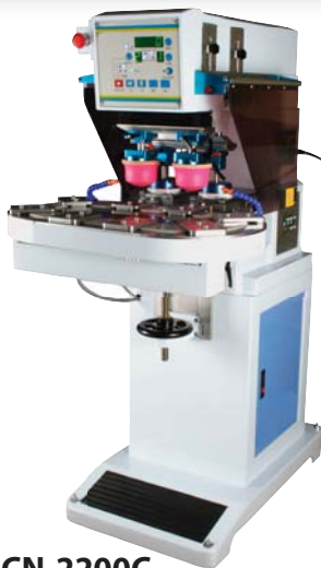
ICN-2200C 2 colores, con sistema de carrusel