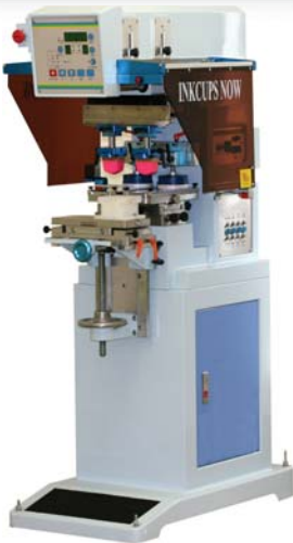
ICN-2200PS 2 colores, con tobogán de tampones

Todas las impresoras son capaz de comprimir tampones (pads) de impresión de gran dimensión, ofreciendo imágenes nítidas y de alta calidad. Las máquinas son fuertes y resistentes, ideales para el uso pesado, muy fáciles de usar no solo para un técnico con experiencia, pero también para un usuario nuevo. Todas las impresoras vienen con soporte técnico atento sin cargo, en español y en inglés.