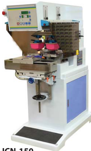
ICN-150 2 colores, copas de 150mm