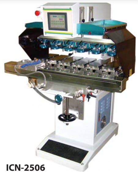
ICN-2506 6 colores