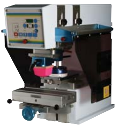
ICN B100 1 color, de mesa