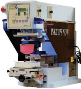
ICN B150 1 color, copa de 150mm

Inkcups Now ofrece una línea de impresoras semiautomáticas de tampografía, con modelos que van desde 1 a 6 colores. Las máquinas pueden ser equipadas con herramientas y accesorios diversos, incluso los hechos a la medida. Todas las impresoras vienen con los VersaCups – nuestras copas patentadas de tinta de diseño universal, que van desde 60 a 150mm para satisfacer diversas necesidades de producción. Las impresoras cuentan con sistema de desplazamiento del cabezal ajustable, retraso programable y cambios de placa o copa sin necesidad de herramientas.