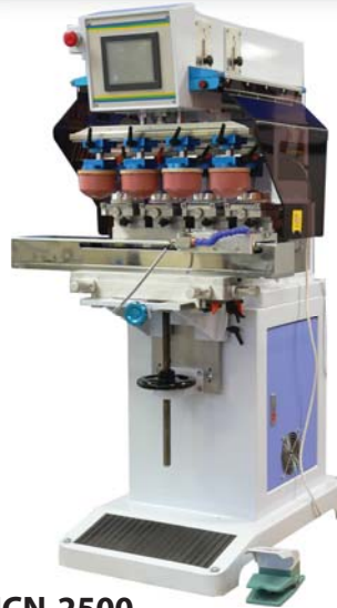
ICN-2500 4 colores