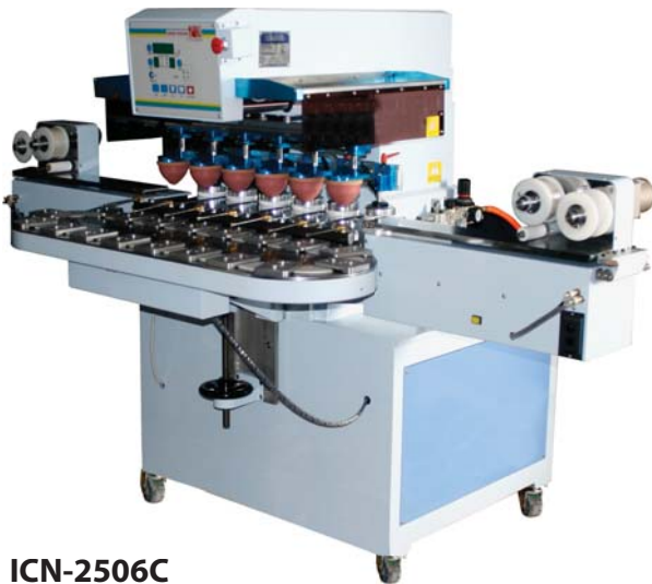
ICN-2506C 6 colores, con sistema de carrusel