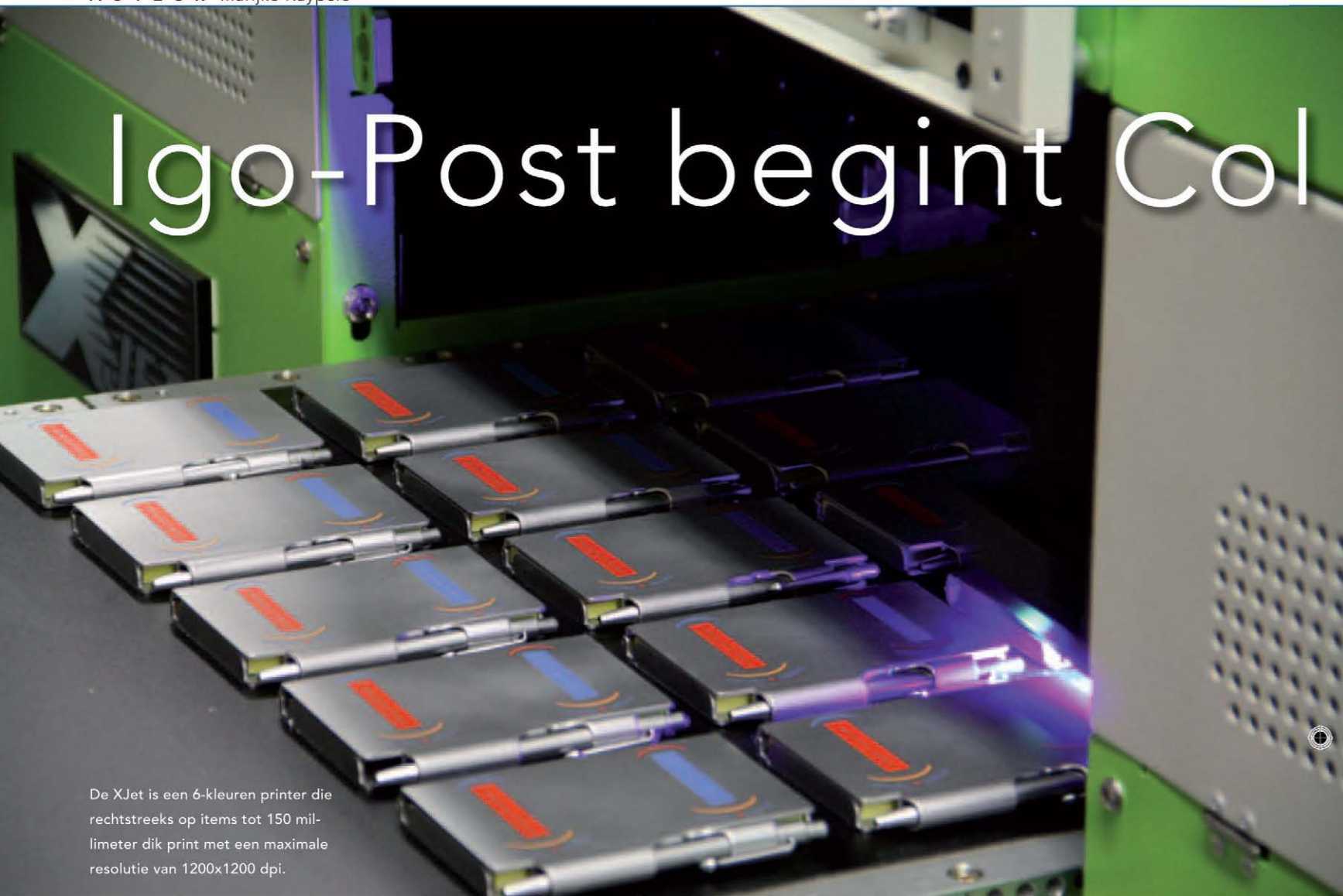
De XJet is een 6-kleuren printer die rechtstreeks op items tot 150 millimeter dik print met een maximale resolutie van 1200x1200 dpi.