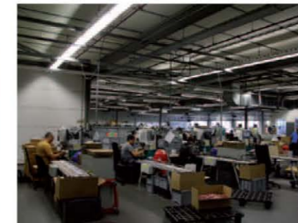
In totaal staan er 27 tampondrukmachines in Helmond.