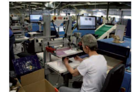
Bij Igo-Post wordt 70 procent van alle orders middels tampon- en zeefdruk bedrukt en 10 procent gaat digitaal.

Het begon met de aanschaf van één XJet, maar binnen enkele maanden heeft Igo-Post drie van deze industriële UV led-inkjetprinters op haar productielocatie in Helmond staan. Een van Europa's grootste leveranciers van bedrukte relatiegeschenken en promotionele artikelen is zelfs een aparte campagne begonnen rondom deze technologie: Coloriprint.